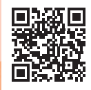
アスリートサイト